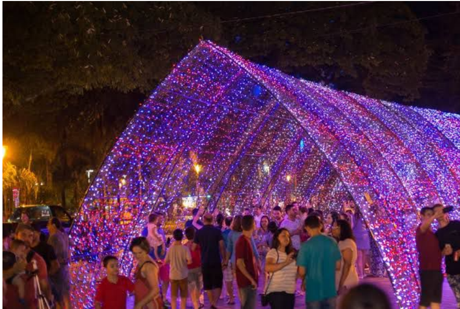
Figura 12 - Passarela