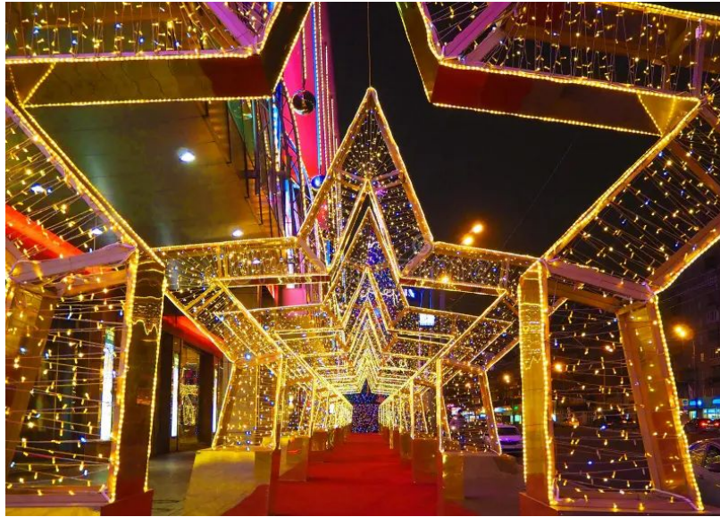
Figura 10 - Estrelas