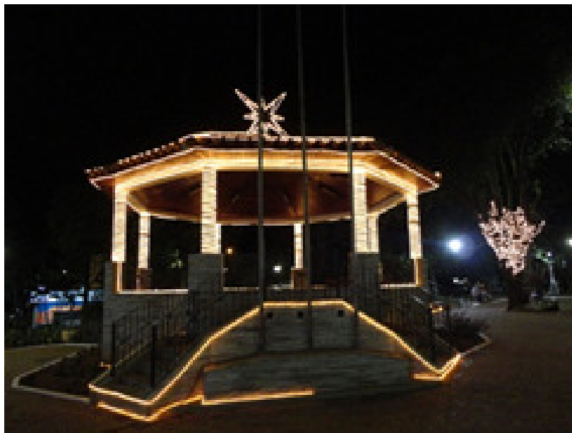
Figura 8 – Coreto da Praça Ary Coelho