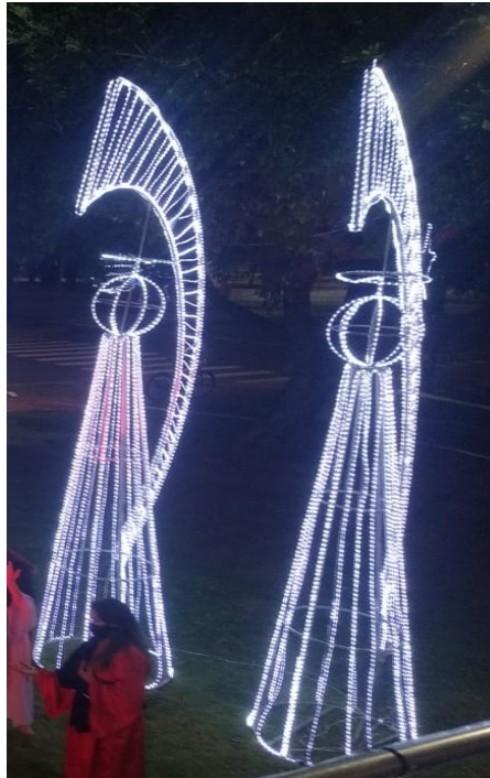
Figura 4 - Anjos Iluminados - 14 de Julho