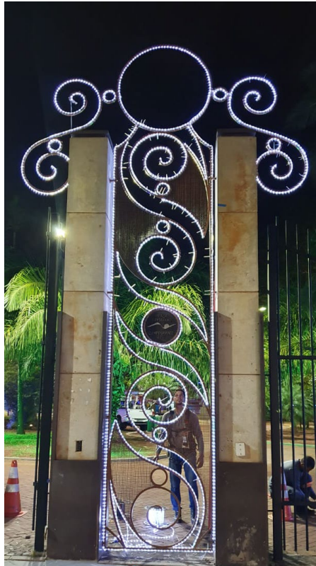
Figura 7 - Portais de Entrada da Praça Ary Coelho