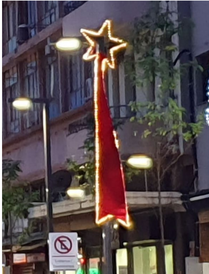
Figura 2 - Flâmulas Natalinas - 14 de Julho