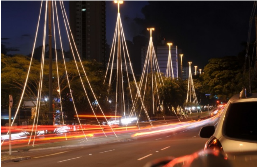
Figura 1 - Representação Árvores de Natal – Postes