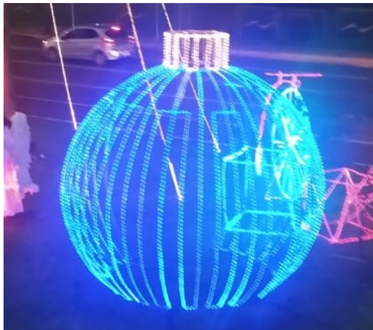
Figura 3 - Bolas metálicas - 14 de Julho