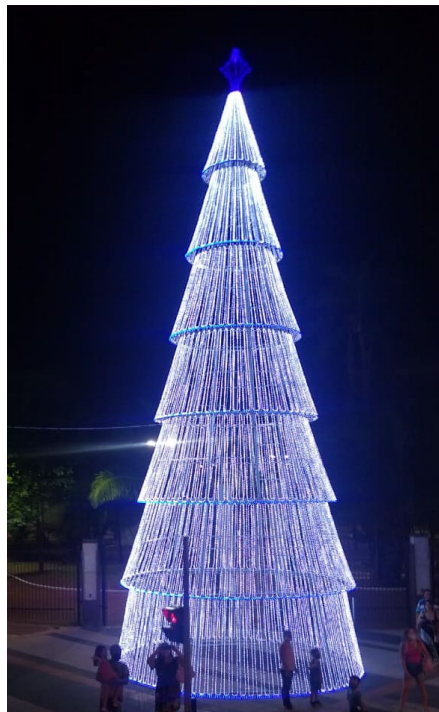
Figura 5 – Árvore em formato de cone - 14 de Julho