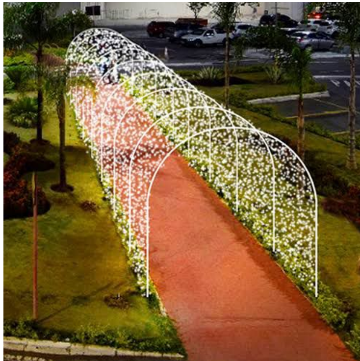
Figura 11 - Pórticos