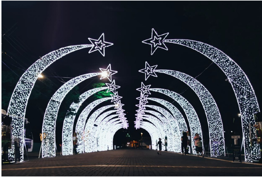
Figura 6 - Pórticos Metálicos – 14 de julho